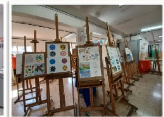
Laboratorios y Gabinete histórico, Aulas de Artes