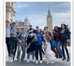
Intercambios Inmersión Lingüística