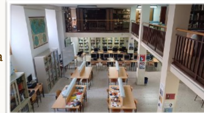
Biblioteca abierta mañana y tarde

Horarios y recreos diferentes para 1-3º ESO. Entrada 8:20 h. Salida: 14:15 h. Sección francés: 4 días a las 15:15 h. 1º ESO situado en un pasillo separado A partir de 2-3º ESO, viajes e Intercambios escolares Aprendizaje práctico, talleres